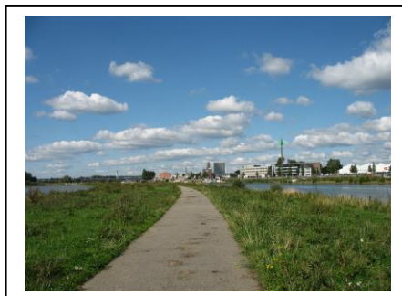
Arnhem op weg naar klimaatneutraal